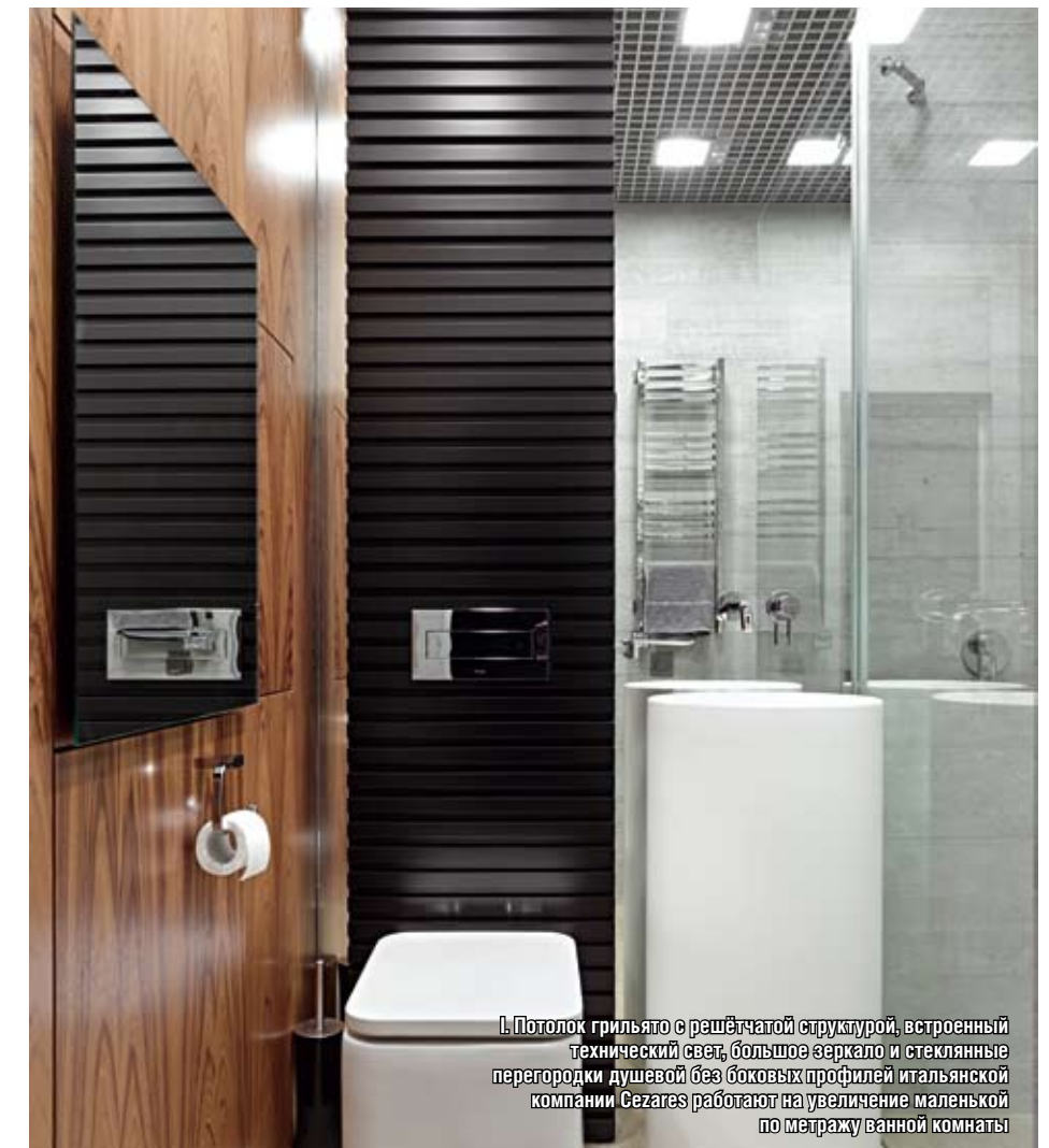
Л. Потолок грильято с решетчатой структурой, встроенный технический свет, большое зеркало и стеклянные перегородки душевой без боковых профилей итальянской компании Cezares работают на увеличение маленькой по метражу ванной комнаты

Небольшая ванная комната приобрела ультрасовременный вид благодаря демонтажу ванной и установке душевой кабины и трёхъярусного шкафа, куда встроены стиральная машина и накопительный электрический водонагреватель итальянской компании Ariston. Цветовая гамма в дизайне этого помещения в единой стилистике, характерной для этого проекта, — сочетании серого, черного, белого и бежевого оттенков. Напольная раковина с цилиндрическим пьедесталом Montebianco Pisa и подвесная сантехника компании Rosa коллекция Element в белом цвете подчеркивают контрастность отделки стен, фактура которых имитирует поверхность бетона. Потолок грильято с его решетчатой структурой, встроенный технический свет, большое зеркало и стеклянные перегородки душевой без боковых профилей итальянской компании Cezares работают на увеличение маленькой по метражу ванной комнаты