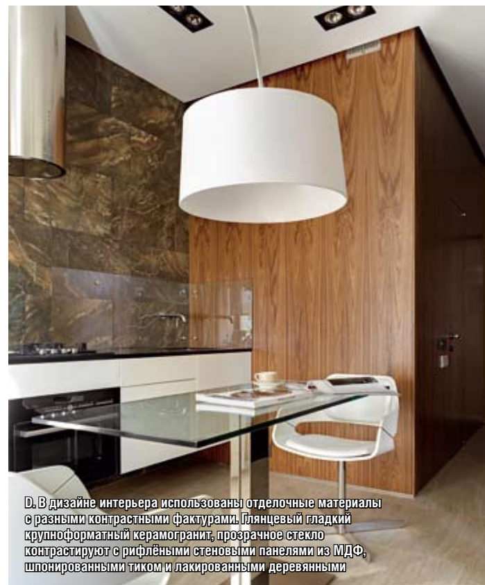
Д. В дизайне интерьера использованы отделочные материалы с разными контрастными фактурами. Глянцевый гладкий крупноформатный керамогранит, прозрачное стекло контрастируют с рифлёными стеновыми панелями из МДФ, шпонированными тиком и лакированными деревянными

рифленые черные стеновые панели из МДФ и лакированные деревянные, шпонированными тиком. Роскоши добавила отделка стены в изголовье кровати натуральной кожей, брутальность в дизайн интерьера внес бетонный ригель. Этот линейный конструктивный строительный элемент был очищен, отмыт и оставлен в первоначальном виде со следами отпечатков опалубки. Ригель нашел дополнительное функциональное применение: со стороны кухни на него установили систему кондиционирования. За счет такого необычного расположения коробка сплит-системы совершенно незаметна. Стандартная система отопления была демонтирована и заменена на дизайнерские стальные трубчатые радиаторы отечественной компании Сунержа.