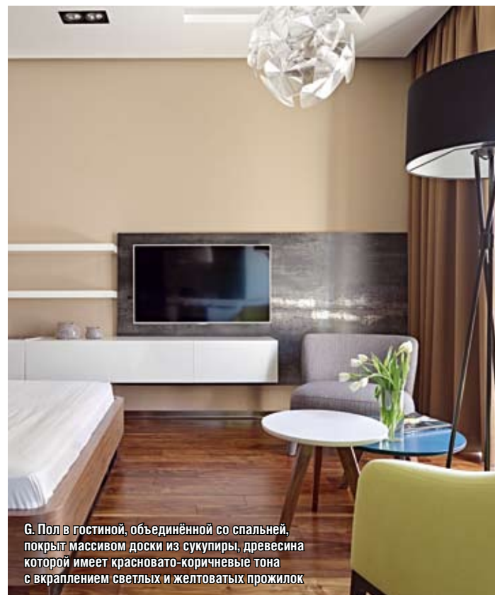
Г. Пол в гостиной, объединённой со спальней, покрыт массивом доски из сукупиры, древесина которой имеет красновато-коричневые тона с вкраплением светлых и желтоватых прожилок