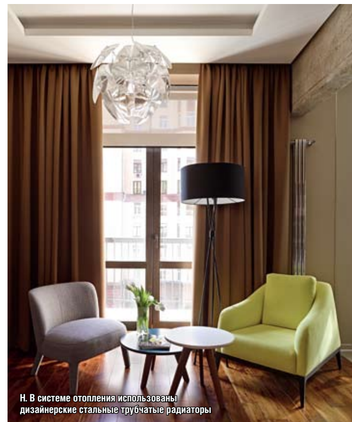
Н. В системе отопления использованы дизайнерские стальные трубчатые радиаторы

весьма характерной текстурой. Такие поверхности декоративны и вместе с тем практичны, поскольку древесина сукупиры прочная, содержит много маслянистых веществ и поэтому практически не подвержена повреждению.