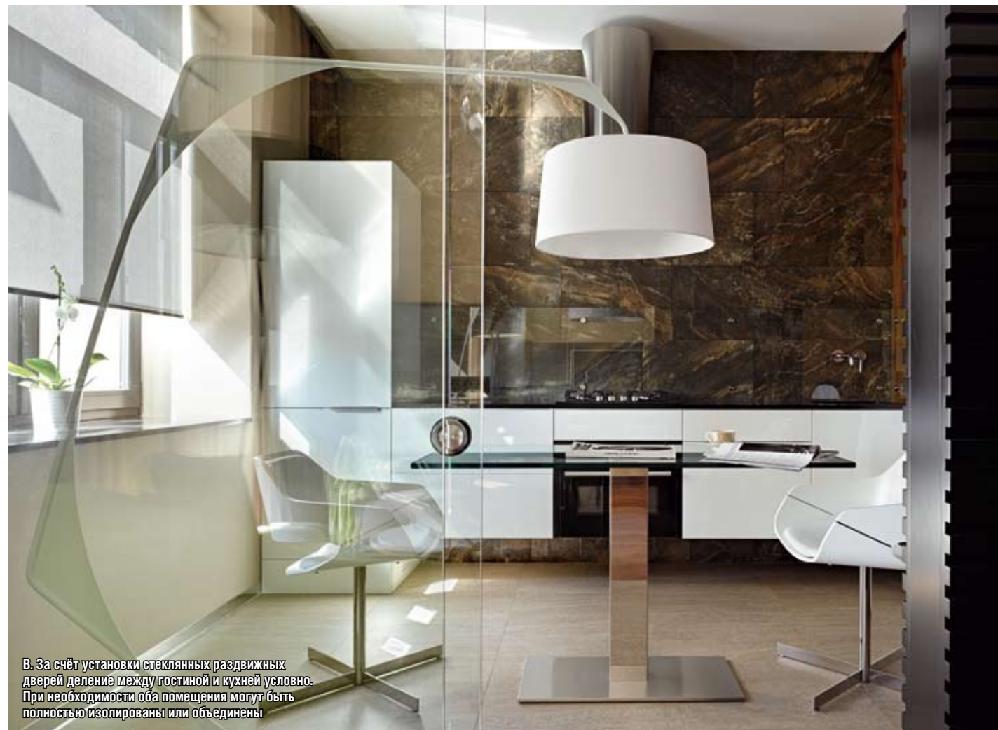
В. За счёт установки стеклянных раздвижных дверей деление между гостиной и кухней условно. При необходимости оба помещения могут быть полностью изолированы или объединены.