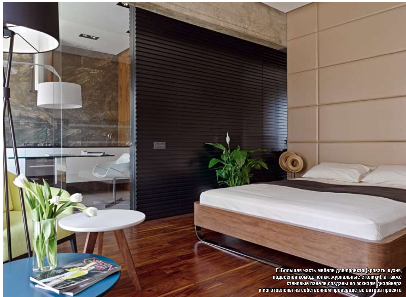
Г. Большая часть мебели для проекта (кровать, кухня, подвесной комод, полки, журнальные столики), а также стеновые панели созданы по эскизам дизайнера и изготовлены на собственном производстве автора проекта