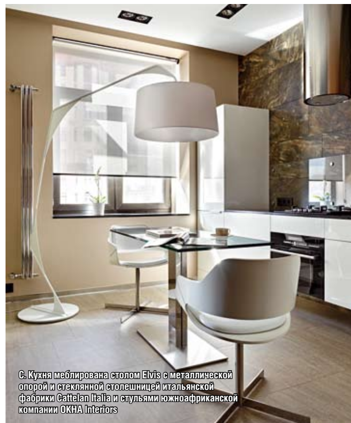
С. Кухня меблирована столом Elvis с металлической опорой и стеклянной столешницей итальянской фабрики Cattelan Italia и стульями южноафриканской компании OKHA Interiors.