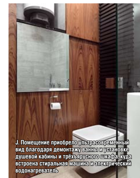
Л. Помещение приобрело ультрасовременный вид благодаря демонтажу ванной и установке душевой кабины и трёхъярусного шкафа, куда встроена стиральная машина и электрический водонагреватель

мощью каких средств и выразительных методов можно создать стильное пространство, максимально функциональное и эстетически проработанное. Д