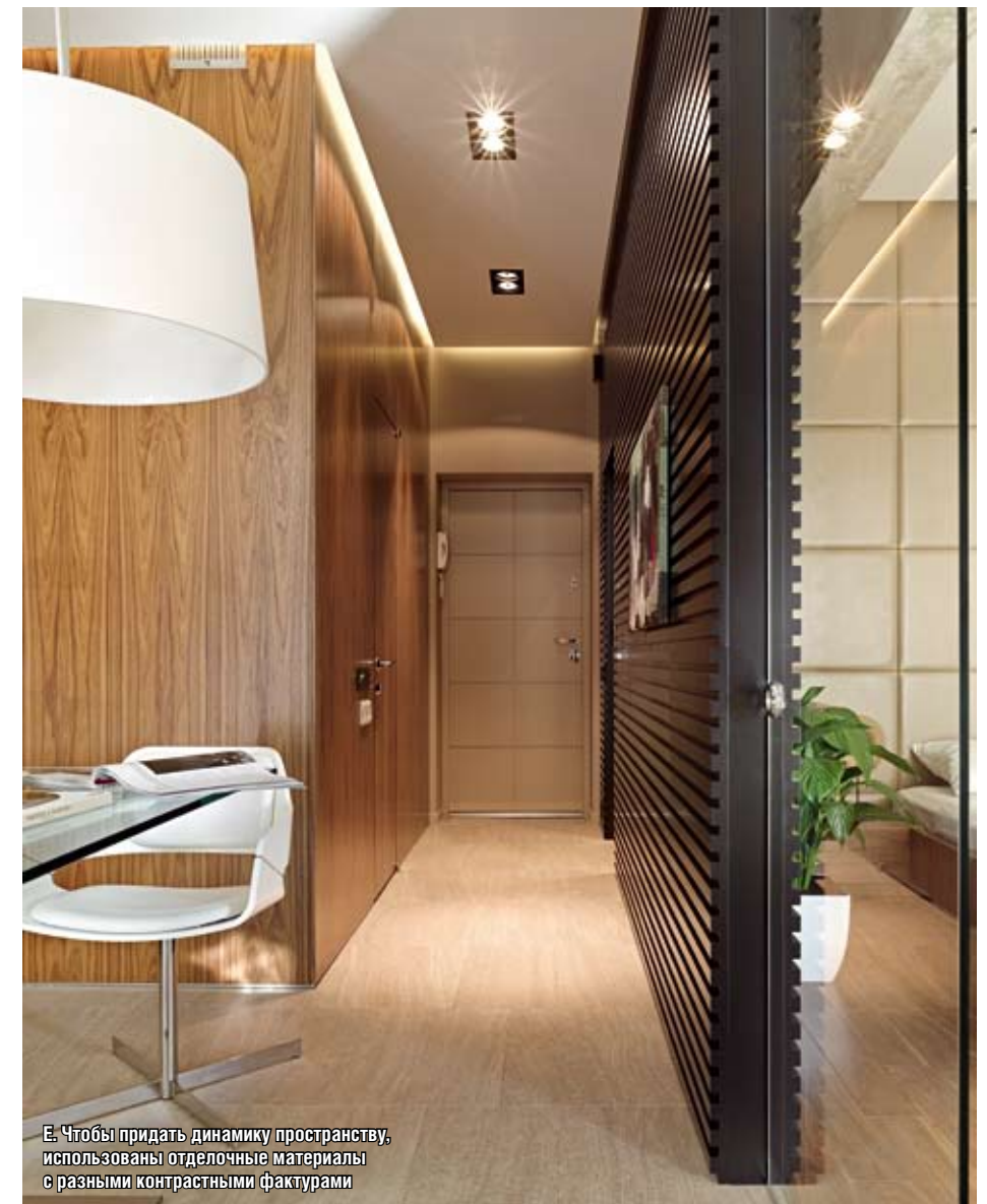
Е. Чтобы придать динамику пространству, использованы отделочные материалы с разными контрастными фактурами

Пол в гостиной-спальне покрыт необычным материалом — массивом доски из сукупиры. Эта редкая древесина имеет красновато-коричневые тона с вкраплением светлых и желтоватых узких прожилок и обладает ▶